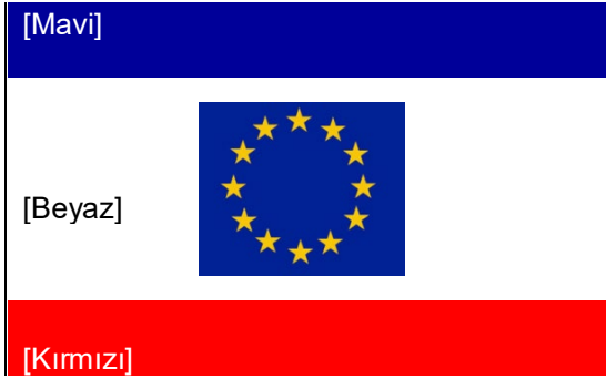
Federal Kıbrıs Cumhuriyeti'nin bayrağı

15.2.1 Kıbrıs Cumhuriyeti'nin bayrakları aşağıdaki gibidir: