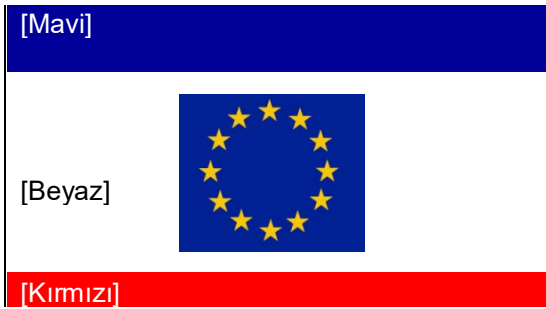
Güney Devletinin bayrağı

15.2.2 Federal Kıbrıs Cumhuriyeti bayrağı, Devlet bayrağı (Devletin mevcudiyeti durumunda) ve Avrupa Birliği bayrağı, tüm ülkedeki tüm kamu binalarında sergilenmelidir. Ülkede başka bir bayrağın yükseltilmesine veya başka bir şekilde sergilenmesine izin verilmez. İstisnai olarak, başka bir ülke veya devletin bayrağı, söz konusu yabancı ülke veya devletin yasal olarak akredite ve yerleşik bir temsilcisinin bulunduğu bir yerde yükseltilebilir veya sergilenebilir. Yabancı devlet adamlarının veya diğer seçkin kişilerin ziyaretleri sırasında, veya çok uluslu bir karakter ve içerikteki organizasyonlarda da yabancı bayraklar gösterilebilir.