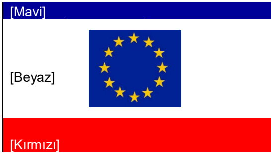
Kuzey Devletinin bayrağı